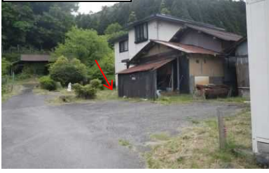
県道篠山京丹波線