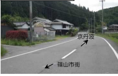
保全対象人家(谷出口より)