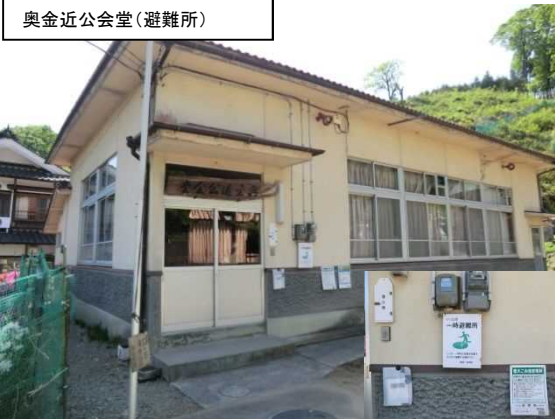
奥金近公会堂(避難所)