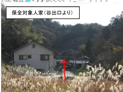
保全対象人家(谷出口より)