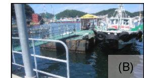
(B) 浮棧橋(高福ライナー(有))