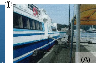
(A) 固定棧橋(高速いえしま(株))