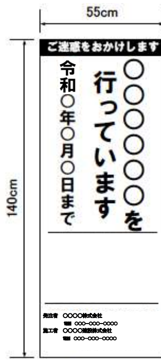
(様式4) 工事説明看板 (占用企業工事)