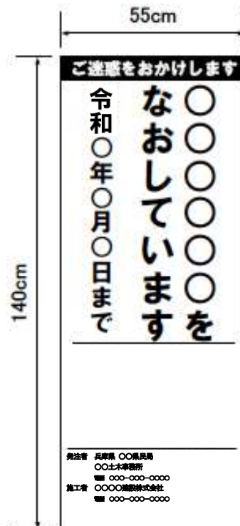
(様式2) 工事説明看板 (道路補修工事)