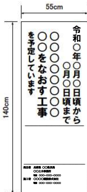
(様式1) 工事情報看板 (道路補修工事)