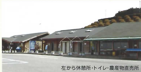
左から休憩所・トイレ・農産物直売所