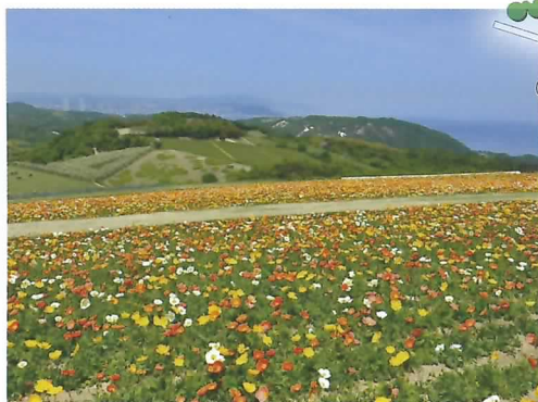
② 花の小径 アイランドポピー 5月