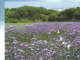
④ ふれあいの花園 バーベナ 6月