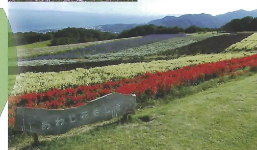
⑤ ふれあいの花園 サルビア 10月