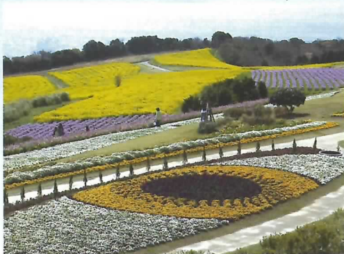
① 歓びの庭から癒しの花園 4月 菜の花・ムラサキハナナ・ビオラ