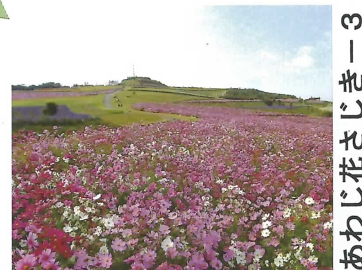
⑥ 癒しの花園 コスモス 10月