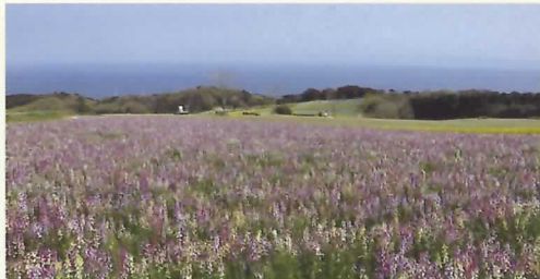
明石海峡・大阪湾を背景に花の大パノラマが展開し、季節により移り変わる愛らしい花々が夢の世界に誘います