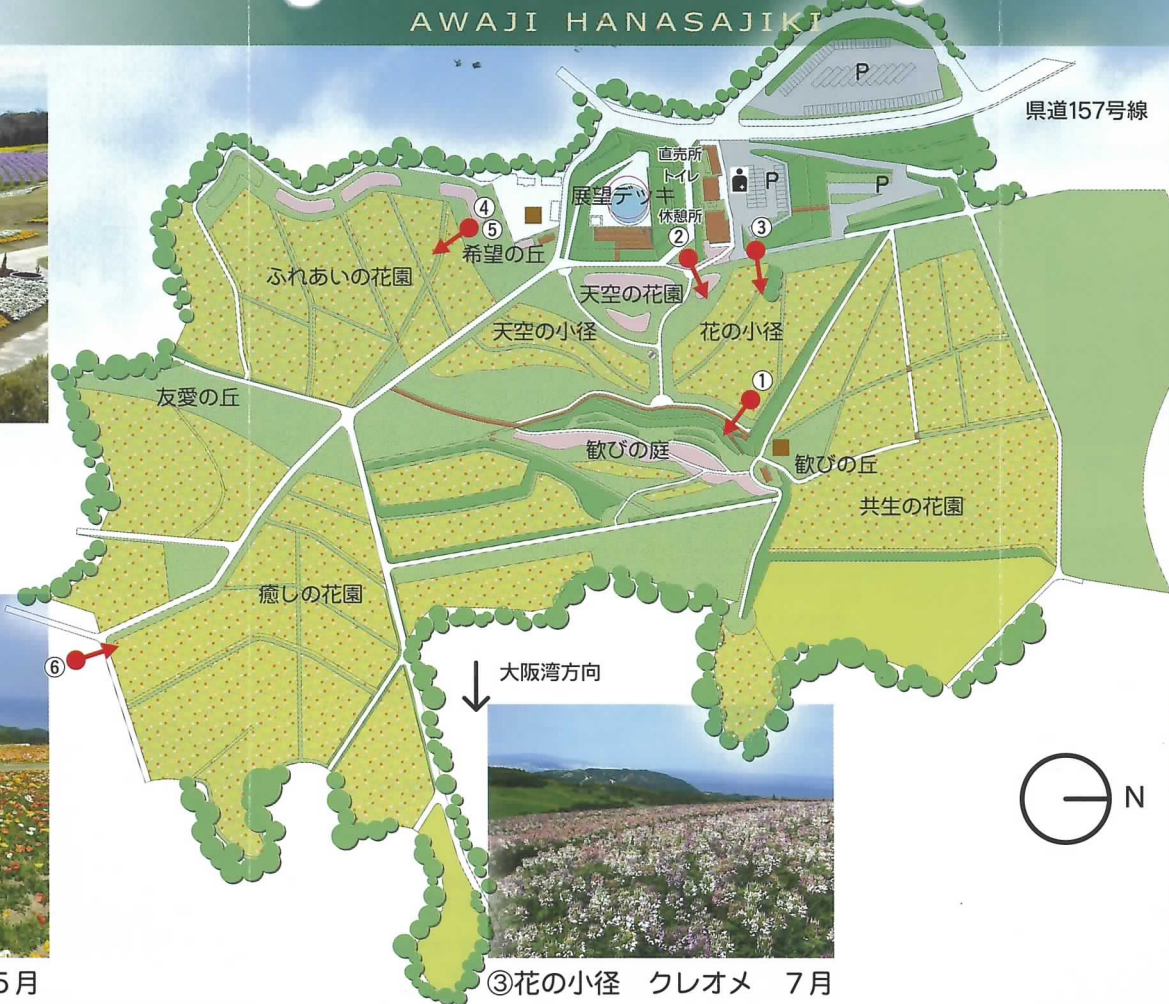
③ 花の小径 クレオメ 7月