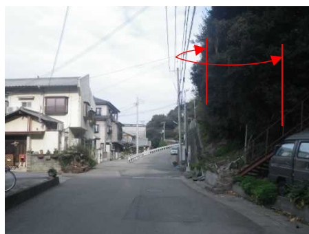
②保全対象とがけの状況