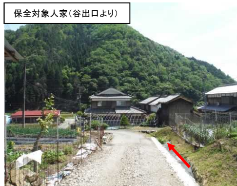
保全対象人家(谷出口より)