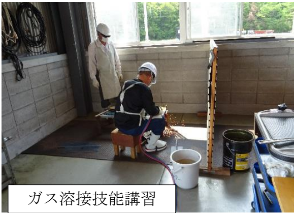
ガス溶接技能講習