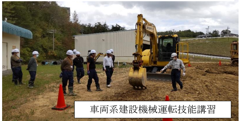
車両系建設機械運転技能講習