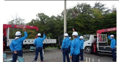
小型移動式クレーン運転技能講習