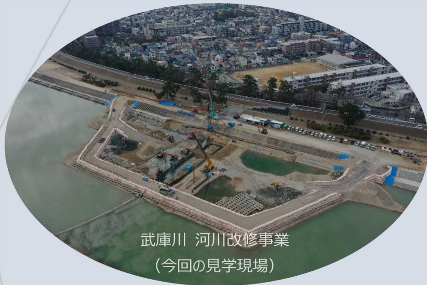
武庫川 河川改修事業 (今回の見学現場)