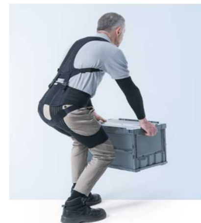
アシストスーツ着用のイメージ