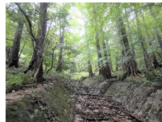
治山遺構施設 (S13災害復旧)