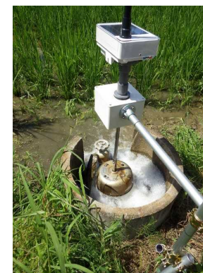
自動給水で水管理