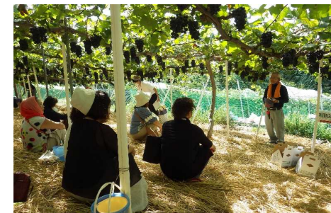
※農業体験等 イメージ