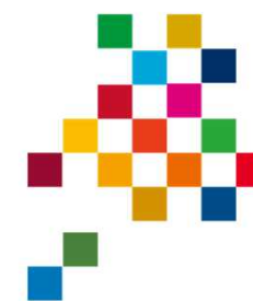
ひょうごフィールドパビリオン

神戸地域のフィールドパビリオンを巡るスタンプラリーを実施 一定数のプログラムを体験した参加者を対象に、神戸ブランド商品を贈呈する