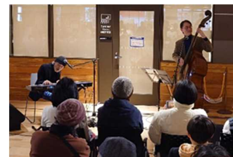
庁舎1階イベントの様子