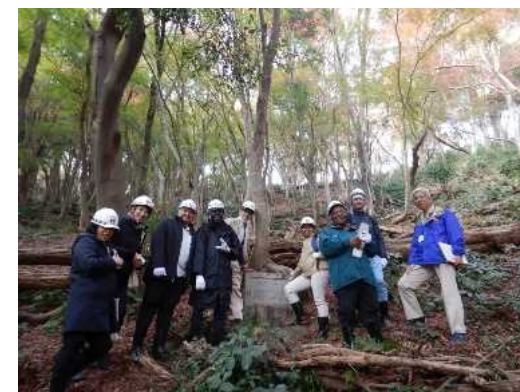
現地案内時の様子