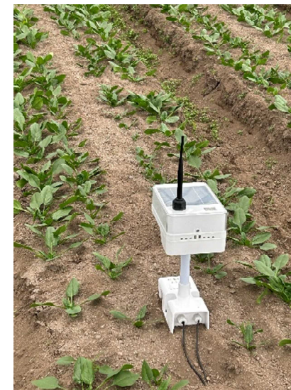
ハウス内のデータの収集

ハウス内の気温、湿度、照度、土壌温度・水分のデータを収集し、見える化することで、夏期における葉物野菜の生育改善を目指す