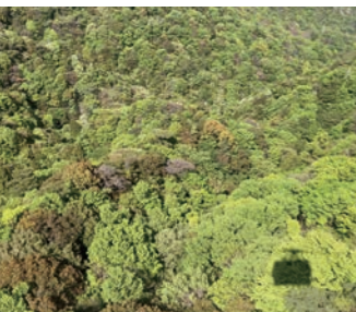
1 这可不是无人机拍的哦 摩耶索道