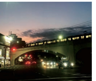
9 银河铁道之夜 阪急王子公园站高架桥