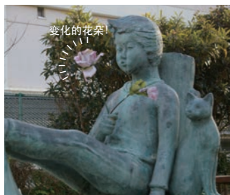
5 持花少年 福住公园