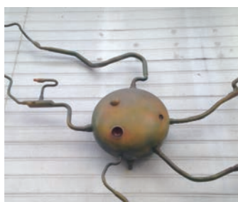
8 商店街的外星人 滩中心商店街