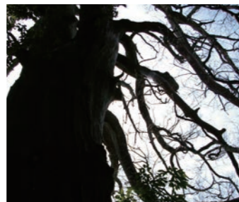
3 摩耶的圣老人 摩耶史迹公园