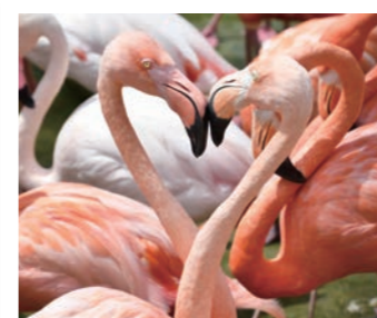
12 火烈鸟之心 摩耶缆车站下