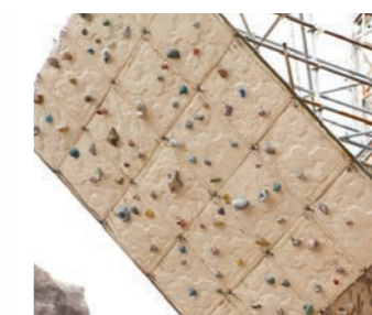
13 可以攀爬的艺术品 神户登山培训所