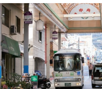
7 拱廊商店街里有穿梭巴士! 滩中央筋商店街