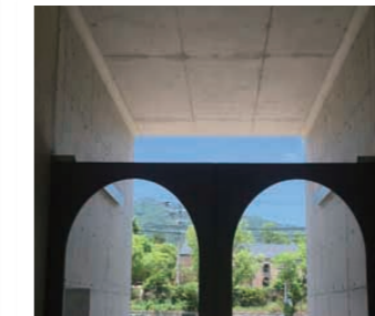
11 天空、群山、砖墙 原田之森画廊