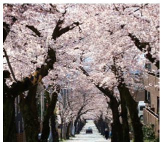
4 樱花隧道 摩耶缆车站下