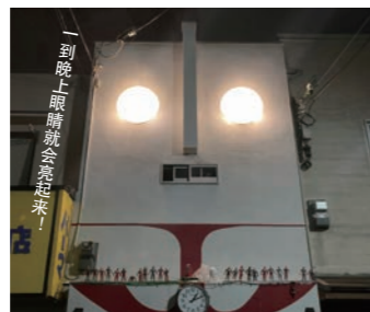
6 奥特曼之家 NADA 怪兽博物馆