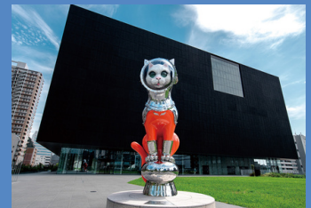
《SHIP'S CAT(Muse)》2021 大阪市北区 香川県小豆島町