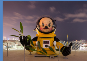
《Jumbo Torayan(Olive)》2013 香川県小豆島町

1965年生まれ。大阪府茨木市出身。1991年京都市立芸術大学大学院修了。京都芸術大学教授。ユーモラスな形態に社会的メッセージを込めた作品群は国内外から評価が高い。香川県小豆島町や大阪中之島美術館など全国各地で大型の野外彫刻を手がけている。