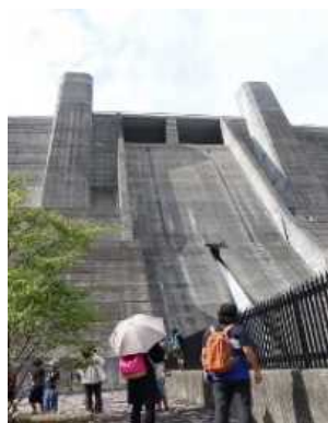
下から見る石井ダムは圧巻です！