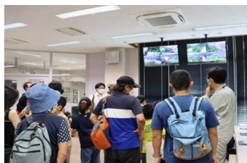
ダムの監視室入室