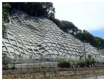
塩屋谷ブロック 斜面对策工 (車窓から見学)