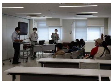
リモートで現場視察