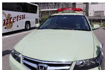
モスグリーンの公用車