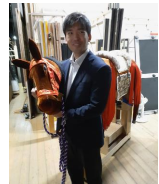
▲バックステージ体験