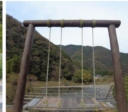
▲川沿いのブランコ