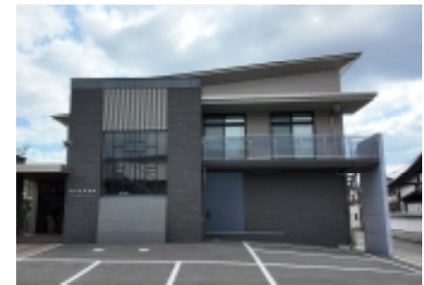
▲マッチの里ミュージアム)