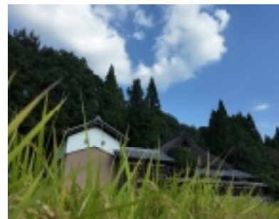
▲農村風景に溶け込む