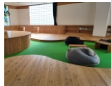
▲コワーキングスペース