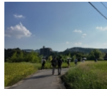
▲高層建築物と農村