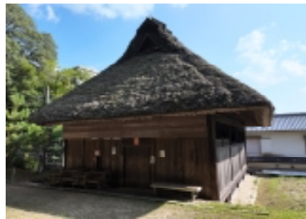
▲下谷上農村歌舞伎舞台