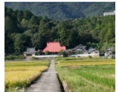
▲拠点の一つ・成道寺