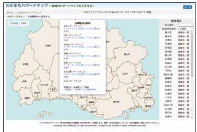
わがまちハザードマップ