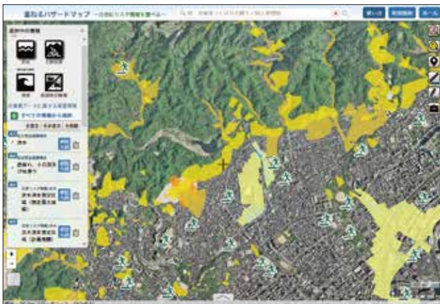
重ねるハザードマップ