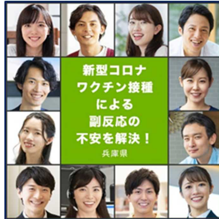
広告掲載しているバナー例