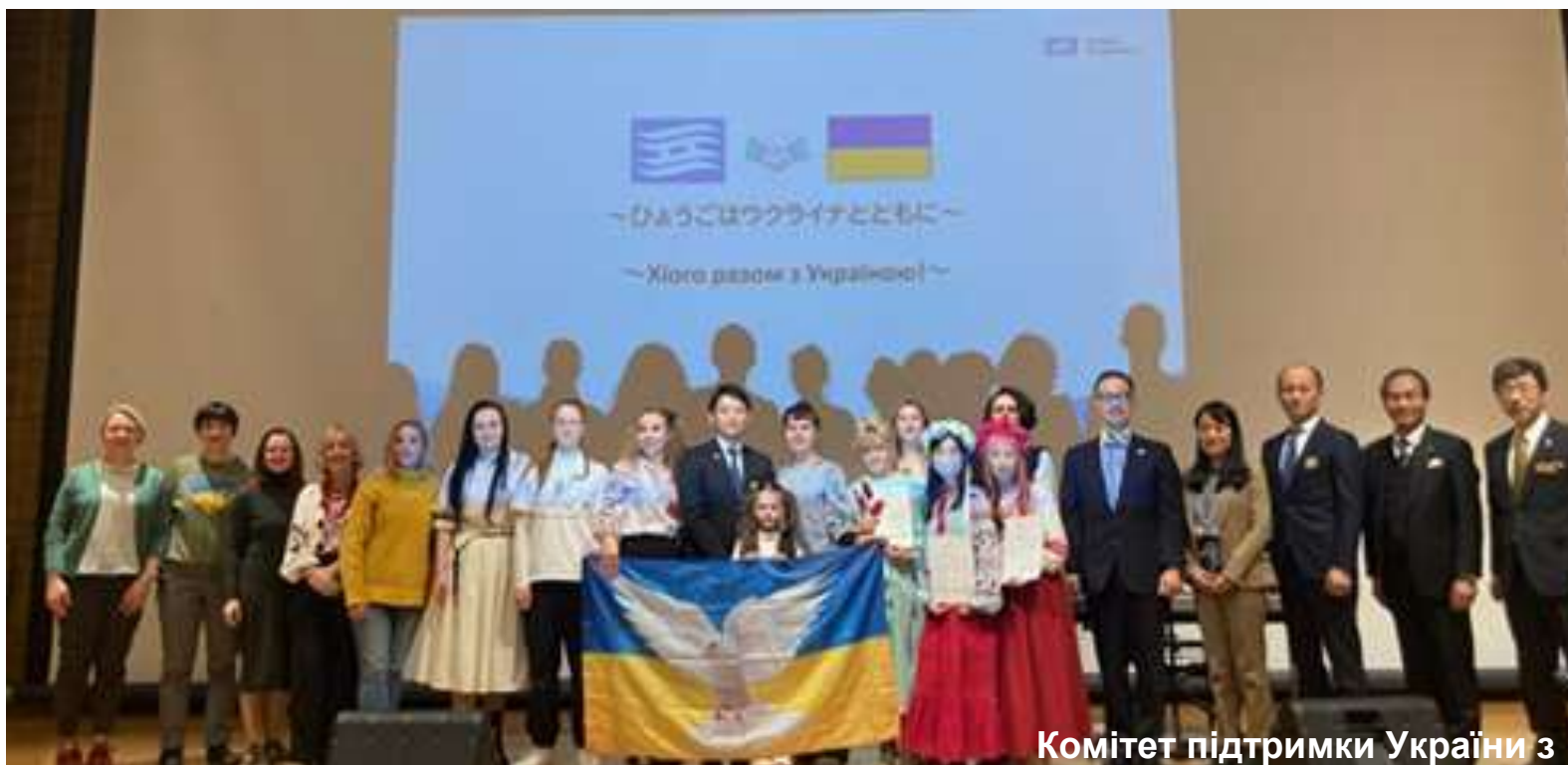
Комітет підтримки України з використанням філософії "творчого відродження"