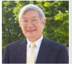
Запрошений доповідач комітету з допомоги Україні Макобе Іюкібе

витяг з виступу 21.04.2023 на першому засіданні комітету з допомоги Україні