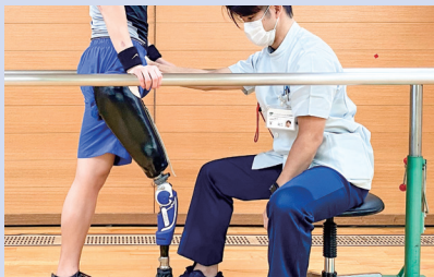
兵庫県立総合リハビリテーションセンター 義手・義足のリハビリを行う人材育成支援のため、ウクライナの医療従事者の受け入れ検討を進めています。

義手・義足のリハビリ、こころのケア分野の人材育成支援や、本県への避難民に対する生活支援を実施します。 また、子ども・学生同士の交流や文化・芸術交流等の支援も検討してまいります。