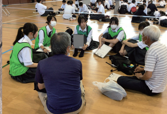
令和7年度受賞校の活動の様子