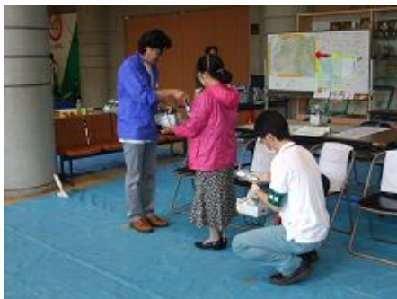
常設スクリーニング会場での検査の様子