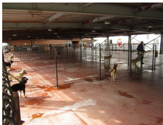
福島県動物救護本部シェルター施設