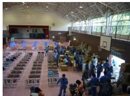
臨時スクリーニング会場の様子