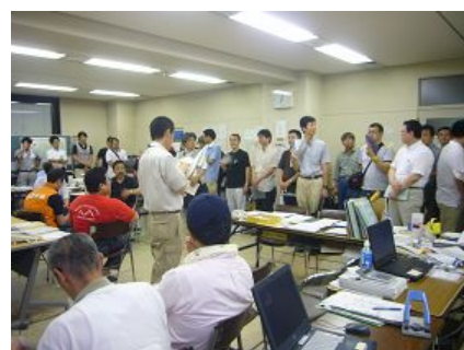
福島県原子力災害対策本部でのミーティングの様子