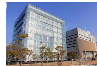
人と防災未来センター