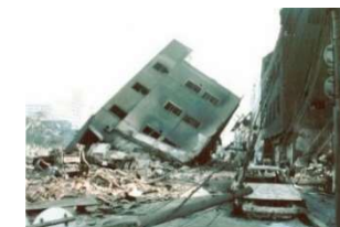
阪神・淡路大震災（H7）