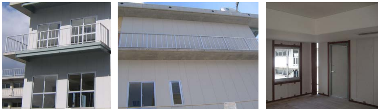
(a) 引き違いはき出し窓 (b) 引き違い窓, 外開き窓 (c) 引き違い窓, ドア (内側)

本実験においては、面内の変形のみならず、面外方向に強制変形、慣性力を受けること、またコーナー部に2方向の面内変形が集中することなど、既往の実験において考察できていない内容が含まれており、こうした条件下においてどのような挙動を示すか観察します。引き違いはき出し窓のガラスにはフロートガラスと合わせガラスが採用されており、ガラスの種類により地震時の挙動がどのように異なるかを検証します。