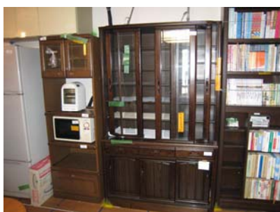
(b) 住宅内部 1