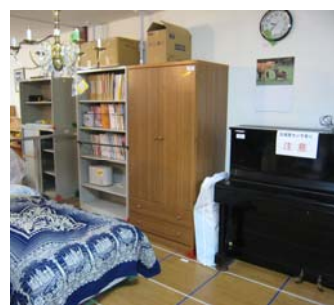
(c) 住宅内部 2