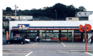
スーパークラモト