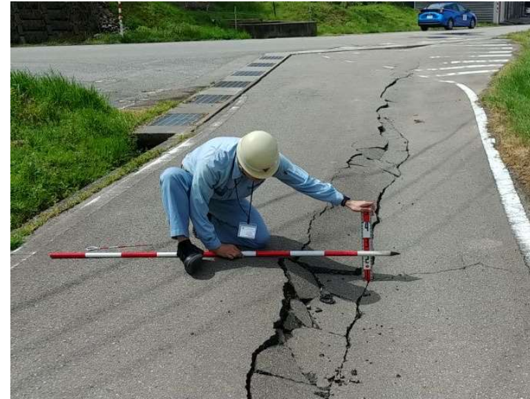
災害査定調査業務(輪島市)