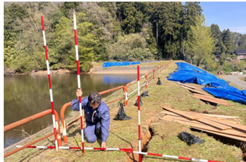
ため池復旧工事測量(珠洲市)