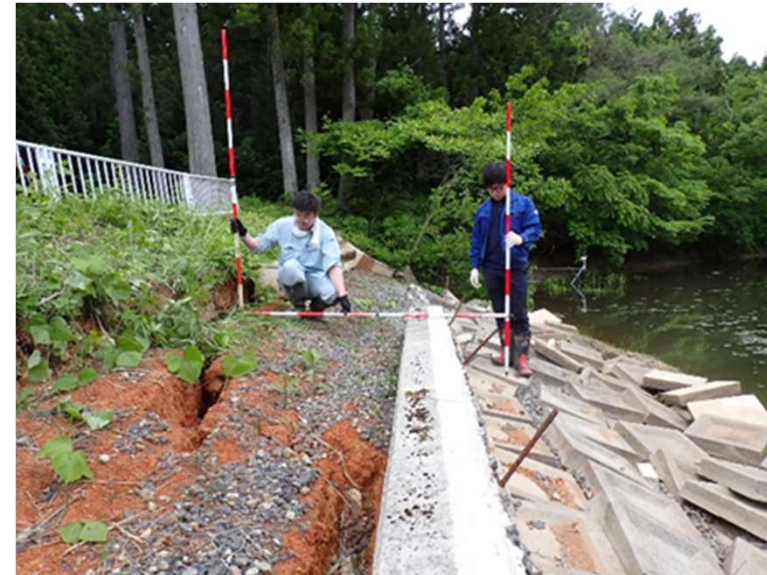
ため池復旧工事測量(珠洲市)