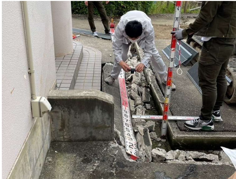
災害査定調査業務(穴水町)