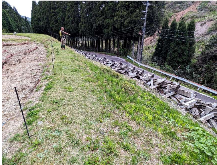
農地農業用施設災害復旧業務(志賀町)