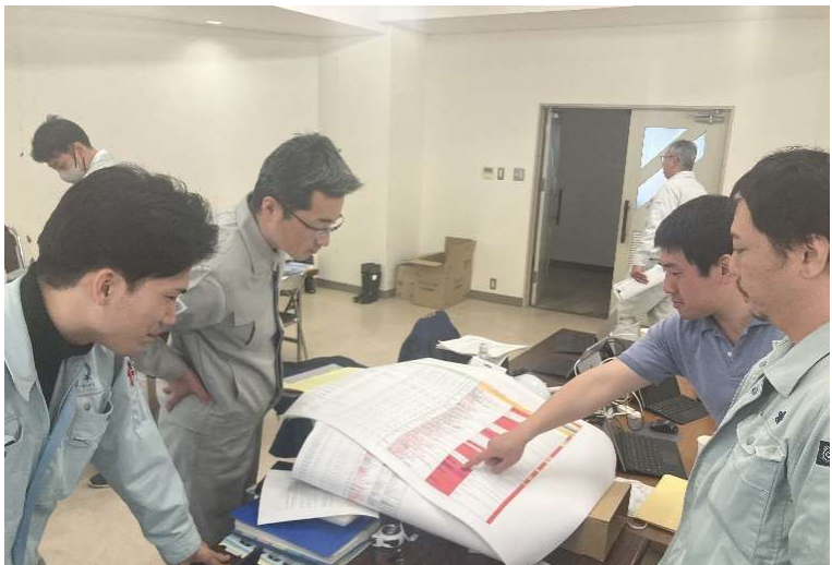
橋梁災害復旧工事の設計(珠洲市)