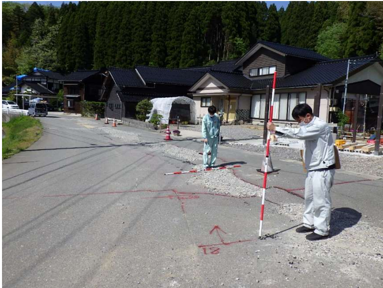
土木復旧業務(志賀町)