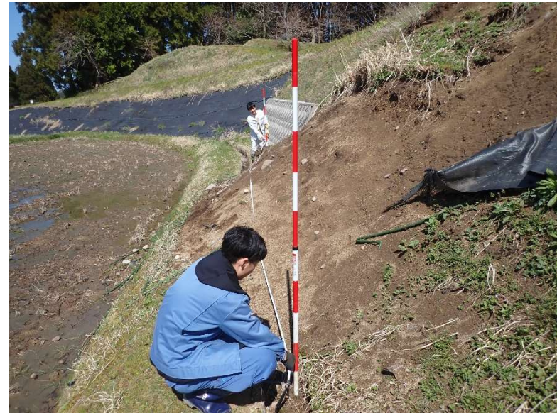
農業用施設の災害復旧(輪島市)