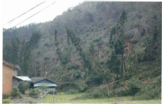
養父市大屋町（風倒木被害）