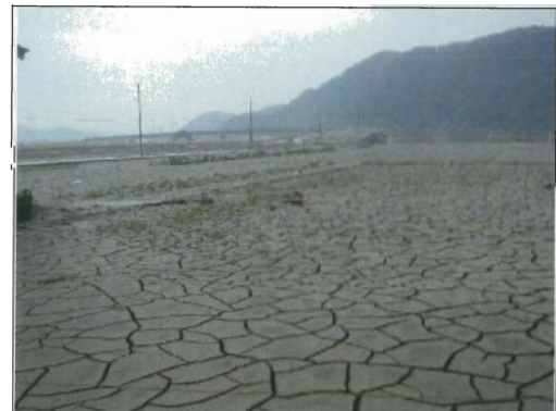
土砂をかぶった農地（豊岡市日高町赤崎）