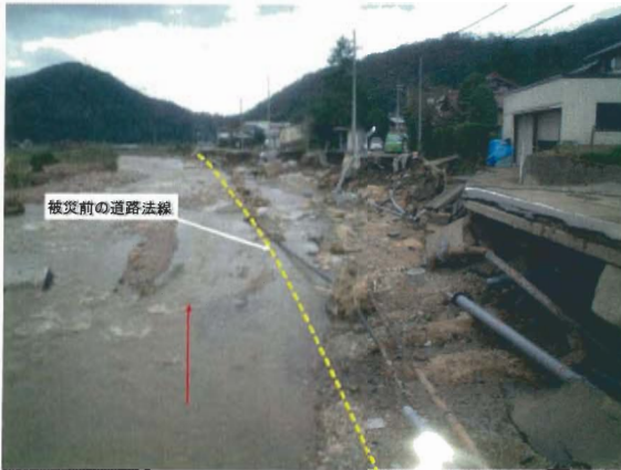
国道426号（豊岡市但東町平田～久畑）