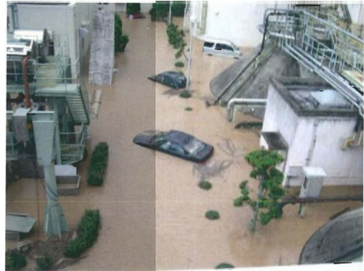
豊岡市浄化センター 浸水状況