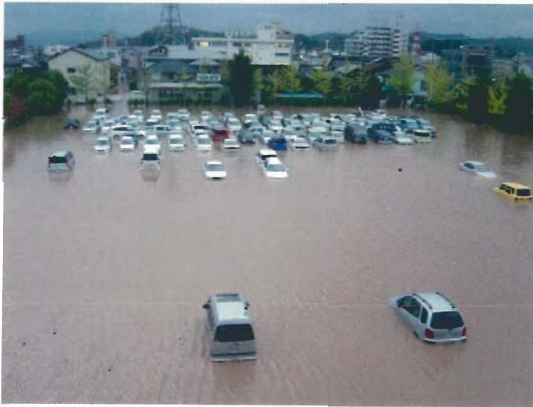
豊岡総合庁舎駐車場 浸水状況