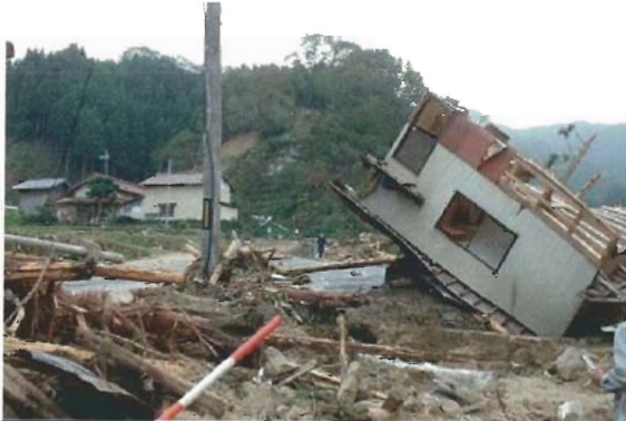
豊岡市但東町奥赤（土砂災害により家屋倒壊）