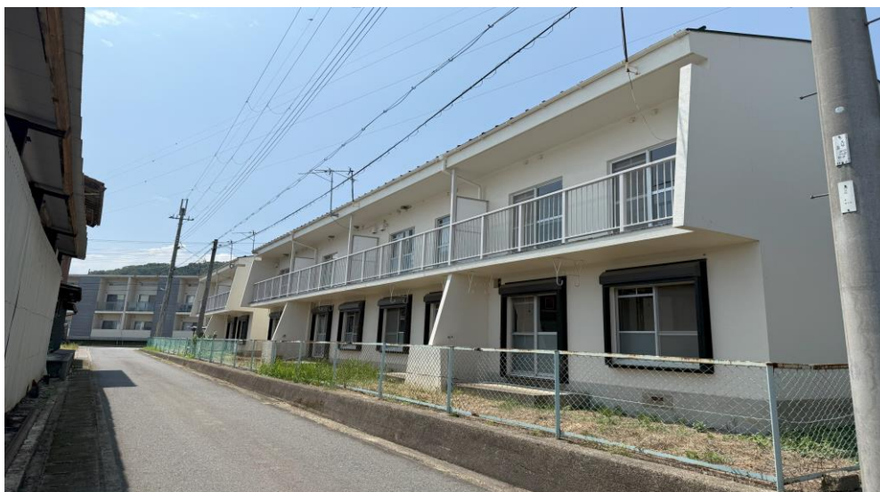
③ 全体図(北東方より)