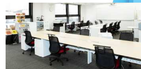
尼崎創業支援オフィスアビーズ