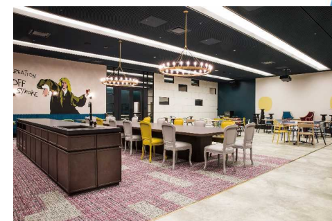
起業プラザひょうご神戸