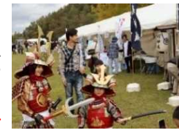
R5.10.21 西播磨フロンティア祭

(7) 機運醸成の実施 地域イベントへの出展等を通じ、FPや万博関係情報の発信による県内機運の醸成