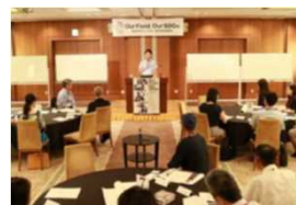
磨き上げ研修会[R5.8月~]