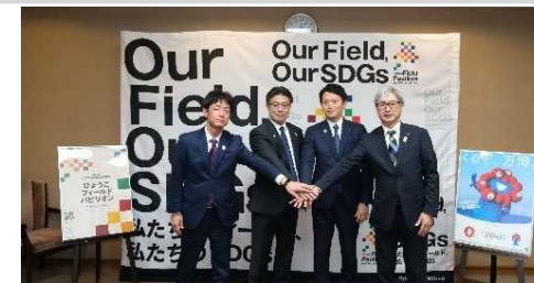
R6.4.11 連携企業との共同会見