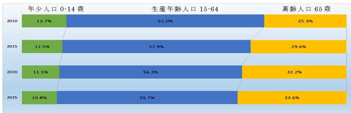
【年齢区分別人口推移…西脇市、小野市、加西市、三木市、加東市、多可町】