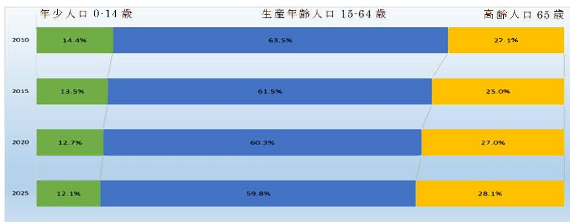
【加東市年齢別人口推移】