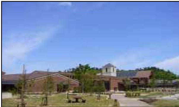
西播磨総合リハビリテーションセンター