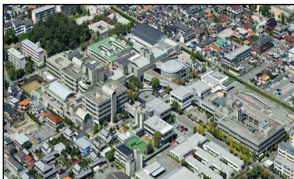
総合リハビリテーションセンター