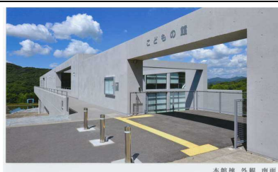
本館棟 外観 南面