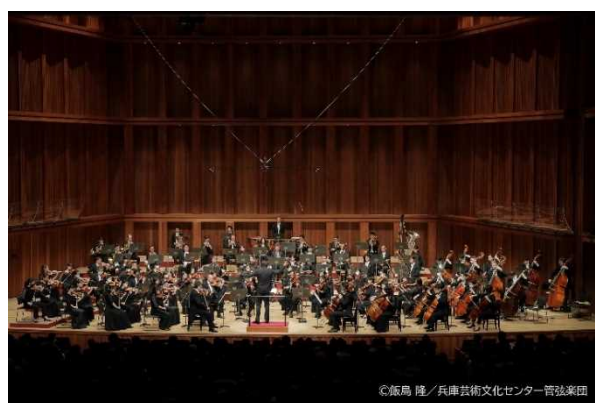
【芸術文化センター管弦楽団】