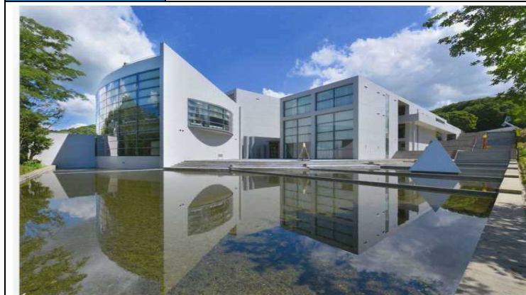
本館棟 外観 西・南面