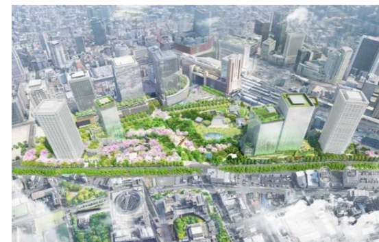
うめきた2期完成イメージ図