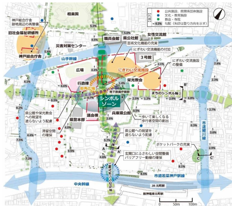
県庁舎等再整備基本計画(案)

国際情勢など建設業を取り巻く環境の変化により、資材・人材不足が顕在化しており、工事費の高騰や工期の遅延が生じていることから、より合理的な投資のあり方を検討する必要がある