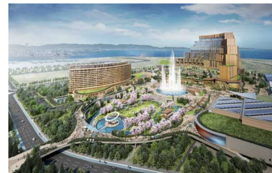
大阪IR構想イメージ図