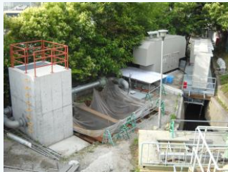
又兵衛抽水場の整備(尼崎市)