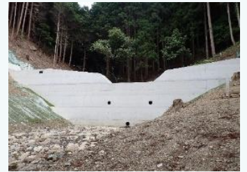
治山ダムの整備(兵庫県)