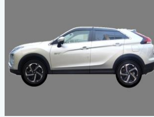
プラグインハイブリッド車の導入 (三木市)