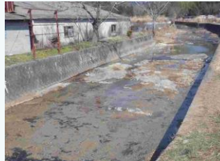
上比延谷川の土砂撤去(西脇市)