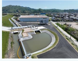
福田排水機場の整備(豊岡市)