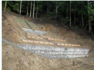
春來地区の治山事業(新温泉町)