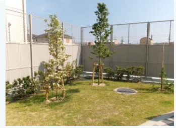
公園の緑化(姫路市)