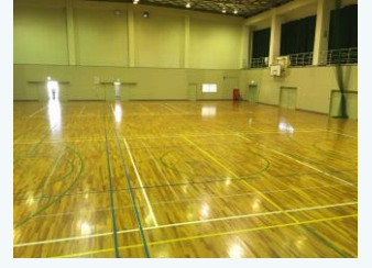
東条第一体育館の空調導入 (加東市)