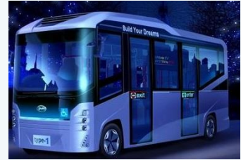
電気バスの導入 (南あわじ市)