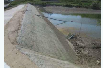
ため池(新池等)の改修(淡路市)