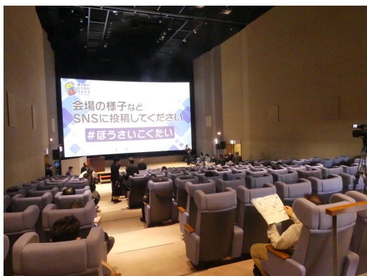
<シンポジウム開催時>