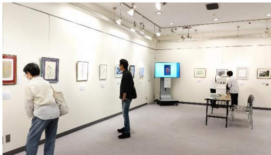
神戸会場(兵庫県民アートギャラリー)