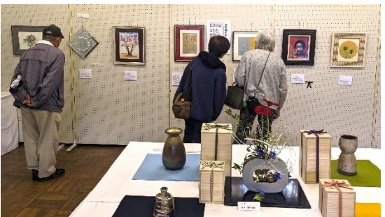
加古川会場(兵庫県いなみ野学園)