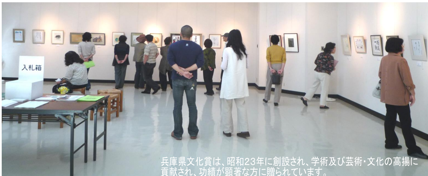
兵庫県文化賞は、昭和23年に創設され、学術及び芸術・文化の高揚に貢献され、功績が顕著な方に贈られています。