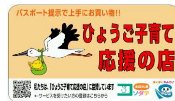
【店舗用ステッカー】