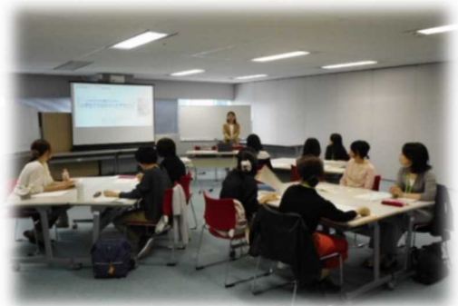
女性のための働き方セミナー