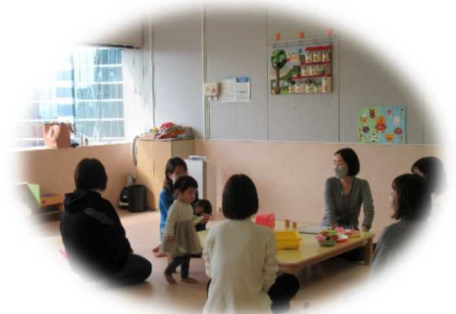
イーブンイベント