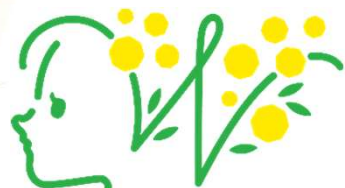
ひょうご・こうべ 女性活躍推進認定 ミモザ企業