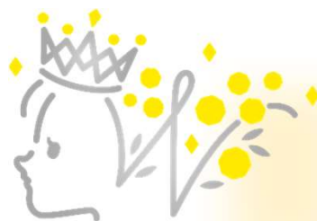
ひょうご・こうべ 女性活躍推進認定 プラチナミモザ企業