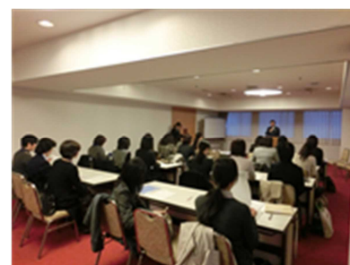
第6期井戸はた学校修了式 (H27. 12. 22)