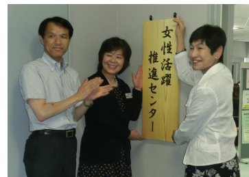
女性活躍推進センター開設式 (H28. 6. 1)