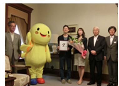
出会い支援事業成婚1,000組 お祝いセレモニー（H27.5.17）