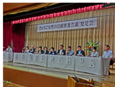
ひょうご女性の活躍推進会議 発足式 (H27. 7. 7)