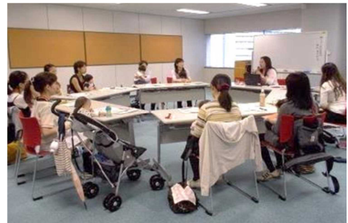
兵庫県立男女共同参画センター