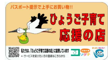
【店舗用ステッカー】