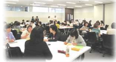
女子大生向けキャリアデザインセミナー