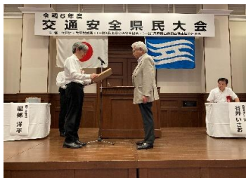
知事感謝状の贈呈式

兵庫県公館において「令和6年度兵庫県交通安全県民大会」が開催され、交通安全功労者等に対する知事感謝状の贈呈式、キッズ交通保安官任命式、加古川市による交通安全対策の取組み、自転車ヘルメット着用促進啓発動画の発表が行われました。