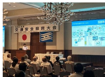
交通安全対策の取組み発表 (加古川市)