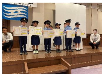
キッズ交通保安官任命式