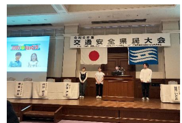
自転車ヘルメット着用促進 啓発動画制作発表