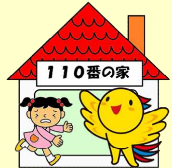
兵庫県マスコット「はばタン」