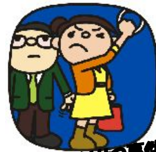
チカン・わいせつ事件