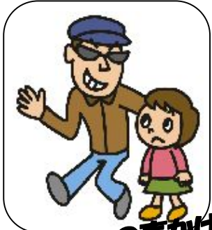
子どもへの声かけ

兵庫県警察本部から、犯罪情報や防犯情報などを登録いただいた方にメールでお知らせしています。※ウェブ接続料・メール受信料は別途かかります。