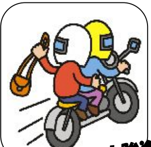
ひったくり・路上強盗