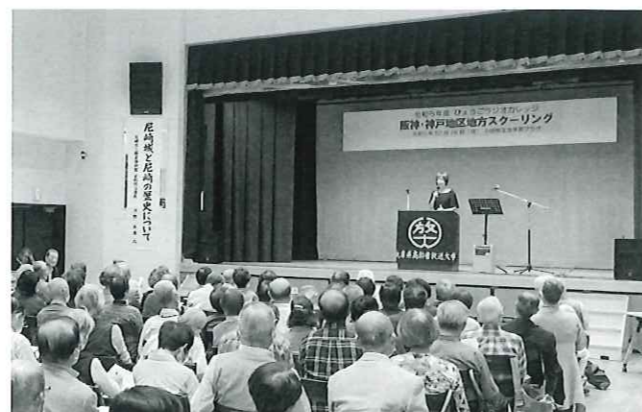
地方スクーリングの様子