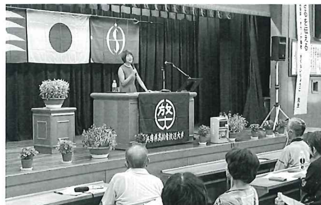
中央スクーリングでの講義