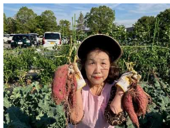
秋の味覚！ サツマイモ収穫