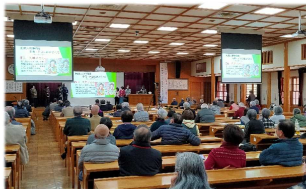
修了レポート発表会風景