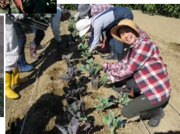
ハボタンの植付作業