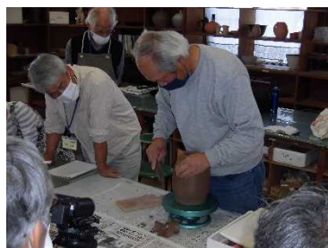
講師による実技指導