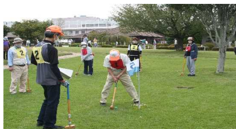
グランドゴルフに真剣に取り組む。学科の授業でも取り入れて実施します。写真はスポーツ大会の様子