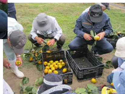
カキを収穫・つるし柿作り

ナシ、ブドウ、カキ、イチジクなど各種果樹の栽培、苗木の作成、つるし柿づくりなど。おいしい果物を作ってみましょう。