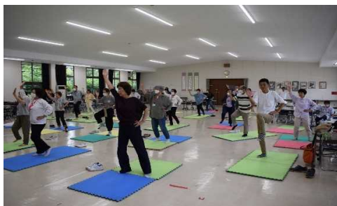
姿勢づくりのためのストレッチと体幹トレーニング