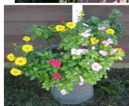
学園生創作寄せ植え

各種草花の種まきから増殖、花壇苗づくり、寄せ植え、ハンギングバスケットの作成など。創意工夫で豊かな暮らしを目指します。