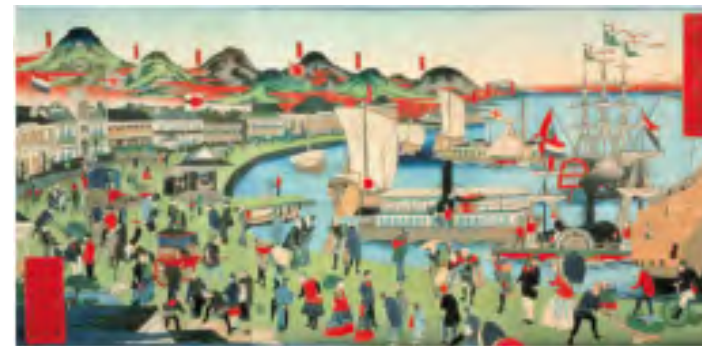
摂州神戸 海岸繁栄之図