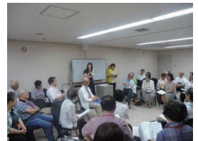
阪神南北地域ビジョン交流会