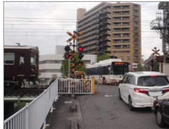
市道逆瀬川停留所線 逆瀬川踏切（宝塚市）