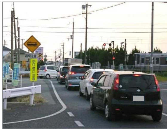
県道野谷平岡線 長ヶ林東踏切（加古川市）