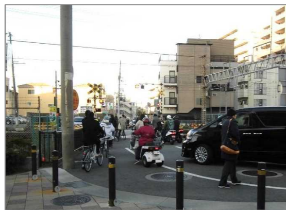
市道主33 御園高江宮浦線 塚口踏切（尼崎市）